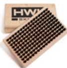
KLEINE HANDBÜRSTE ROSSHAAR 8457 € 21,00

Kleine Handbürste zum Polieren von Flüssigwachsen