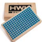
KLEINE HANDBÜRSTE NYLON WEICH 8450-3 € 21,00

Kleine Handbürste zum Polieren von Wachsen