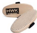
GROSSE HANDBÜRSTE NYLON HART 8450-1 € 32,00

Große Handbürste zum Polieren von Wachsen