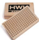
KLEINE HANDBÜRSTE NYLON HART 8450 € 21,00

Kleine Handbürste zum Polieren von Wachsen