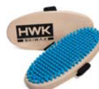
GROSSE HANDBÜRSTE NYLON WEICH 8450-2 € 32,00

Große Handbürste zum Polieren von Wachsen