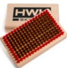
KLEINE HANDBÜRSTE BRONZE FEIN 8454 € 26,00

Kleine Haandbürste zum Ausbürsten der Finish Produkte