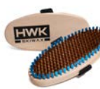
GROSSE HANDBÜRSTE BRONZE FEIN 8454-2 € 47,00

Große Handbürste zum Polieren von Flüssigwachsen