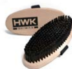
GROSSE HANDBÜRSTE STAHL SCHRÄG 8459-1 € 52,00

Große Handbürste zum Freilegen der Struktur