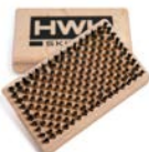
KLEINE HANDBÜRSTE STAHL EXTRAFEIN 8459 € 44,00

Kleine Handbürste zum Freilegen der Struktur