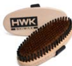
GROSSE HANDBÜRSTE BRONZE HART 8454-3 € 52,00

Große Handbürste zum Freilegen der Struktur