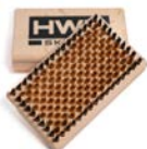
KLEINE HANDBÜRSTE BRONZE HART 8456 € 26,00

Kleine Handbürste zum Freilegen der Struktur